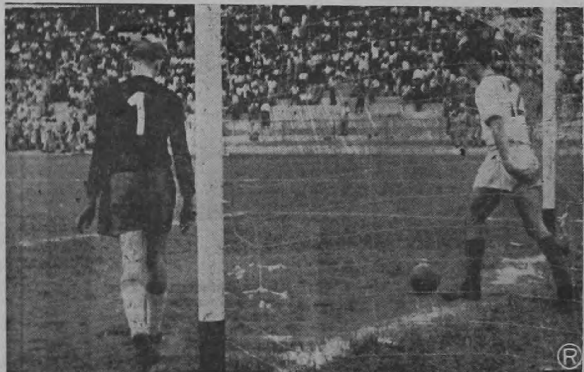
Una vez más la cabaña austriaca ha sido violada por los fogosos delanteros florentinos. Esta escena se repitió nada menos que siete veces. El medivolante Bikel saca la pelota de sus propias redes para mandarla al centro de la cancha. El portero Gartner ante lo irremediable aparece cabizbajo y pensativo. Ha sido la goleada más tremenda sufrida por el Rapid de Viena a través de sus veinte años de existencia.